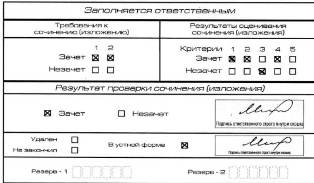
Рис. 11. Область для оценки работы сочинения (изложения) в устной форме